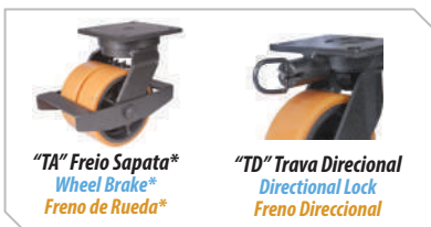
"TA" Freio Sapata* Wheel Brake* Freno de Rueda*